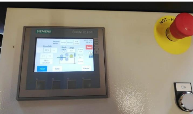
Steuerung Touch Screen (Siemens Steuerung)