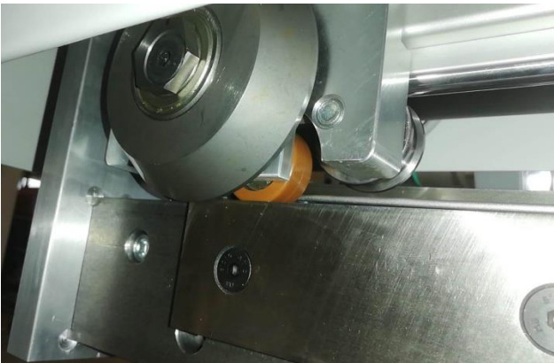
Ober- und Untermesser im Schneidschlitten