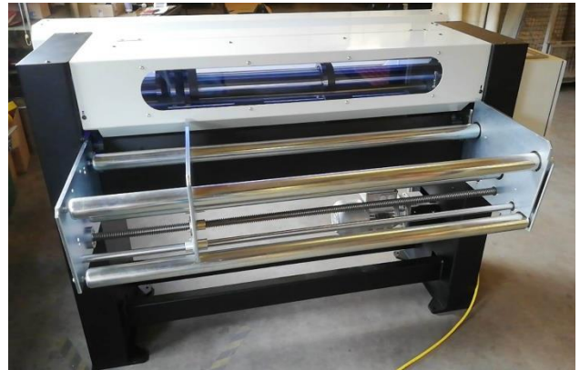
Blecheinlauf der Anlage (mit verstellbarer Führungsbreite)